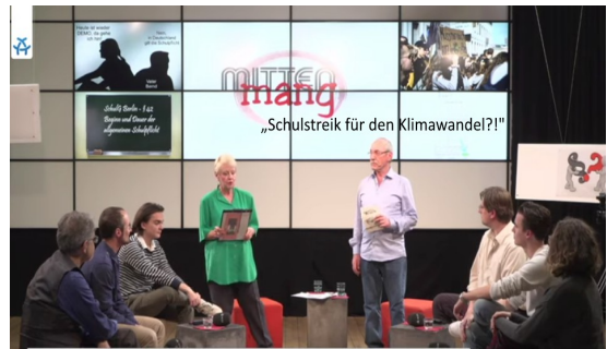
TV-Studio ALEX Berlin

Die positive Resonanz von Teilnehmern unserer Podiumsdiskussion „Schulstreik für den Klimawandel“ am 27. November 2019 ist für das Mittenmang-Team sowie Alex Berlin Ansporn, mit aktuellen Themen die Nähe zum Berliner Bürger auszubauen.